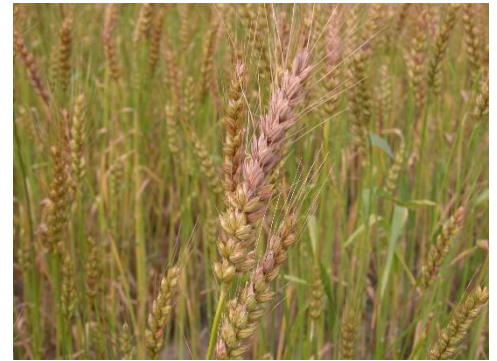
麦に生えたアカカビ

ゼアラレノンに汚染されたとうもろこしや麦類、穀類の飼料を家畜が摂取することで、生殖毒性などの 中毒事例 が報告されています。