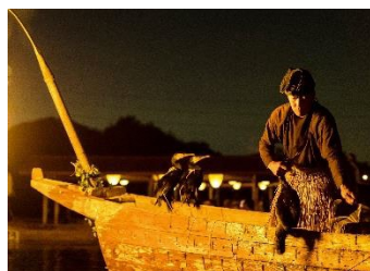
Imagens do peixe Ayu do Rio Nagara e a Pesca Ukai

Esta exposição mostra a cultura peculiar e a natureza abundante do rio a nível mundial - Rio Seiryu Nagara - através da exposição de painéis sobre os seres vivos que habitam o rio e as tradicionais técnicas de pesca tais como o ukai , além da exposição das artes tradicionais ligadas à água tais como o papel Washi e a sombrinha japonesa ( Wagasa ).