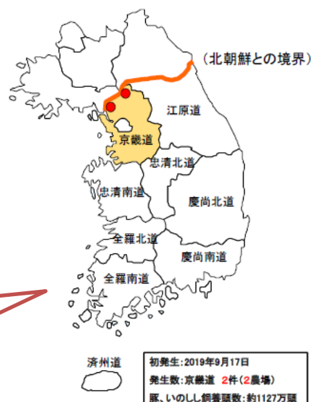
韓国におけるアフリカ豚コレラの発生状況

※ 韓国でアフリカ豚コレラが発生しています！ より一層の侵入防止徹底をお願いします！