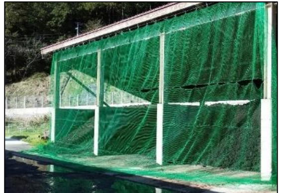
堆肥舎等における防鳥ネットの設置