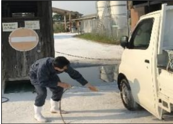
入場車両の消毒徹底、専用服、靴の着用