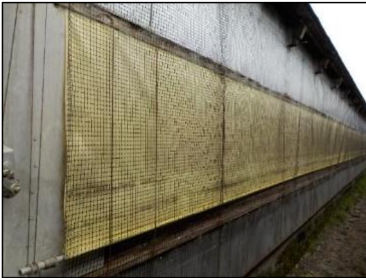
畜舎における防鳥ネットの設置