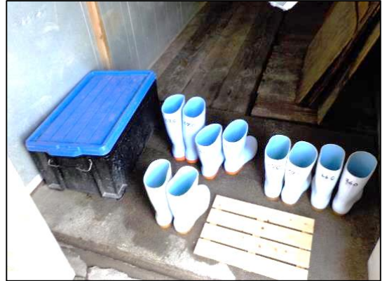
畜舎専用衣服及び靴の着用、手指消毒