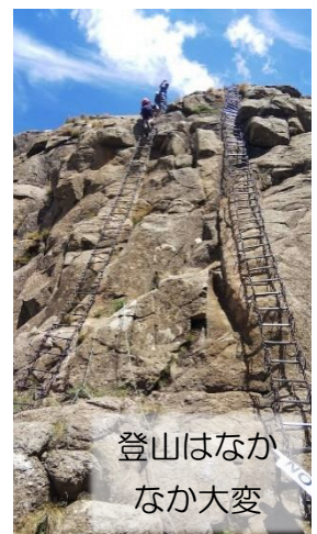
登山はなか なか大変