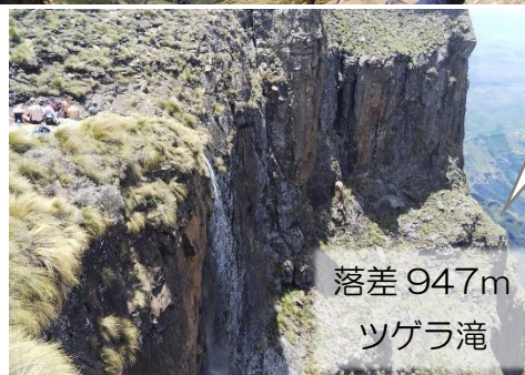
落差 947m ツゲラ滝