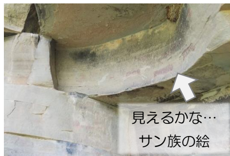
見えるかな… サン族の絵