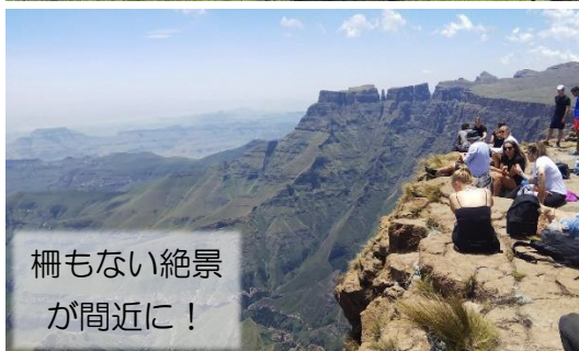
柵もない絶景 が間近に！