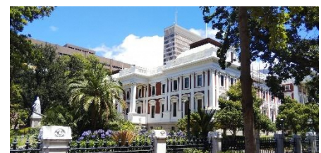
ケープタウンにある国会議事堂

南アフリカの首都は3つあります。国の仕事を行うプレトリア（行政）、法律をつくるケープタウン（立法）、裁判を行うブルームフォンテン（司法）の3つです。日本は東京に全てが集まっているのでなかなかイメージができないですね。