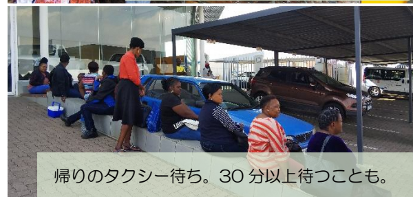
帰りのタクシー待ち。30 分以上待つことも。