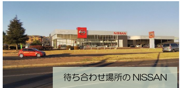
待ち合わせ場所の NISSAN

みんな基本、16 時には仕事を終えます。用事がある人は、15 時に帰ることもあります。昼食から 14 時過ぎに戻ってくる人もいるので、午後はほぼ働いていない人も。ワークショ