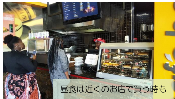
昼食は近くのお店で買う時も