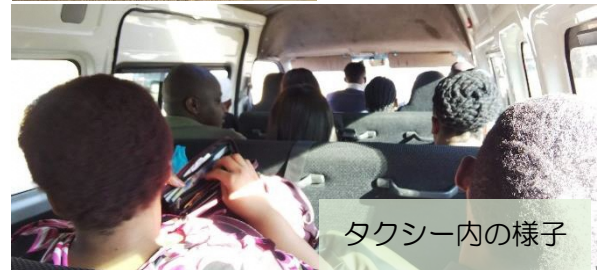
タクシー内の様子