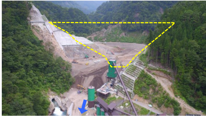
① ダムサイト状況(遠景:下流上空より望む)