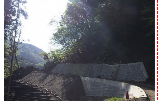
⑤ 下流工事用道路状況