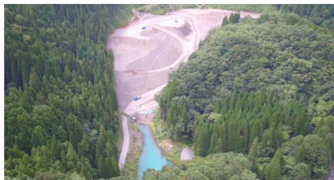
⑥ 土捨場状況(上空より望む)