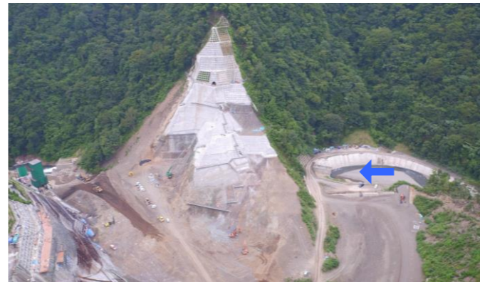
④ ダムサイト右岸状況(左岸上空より望む)