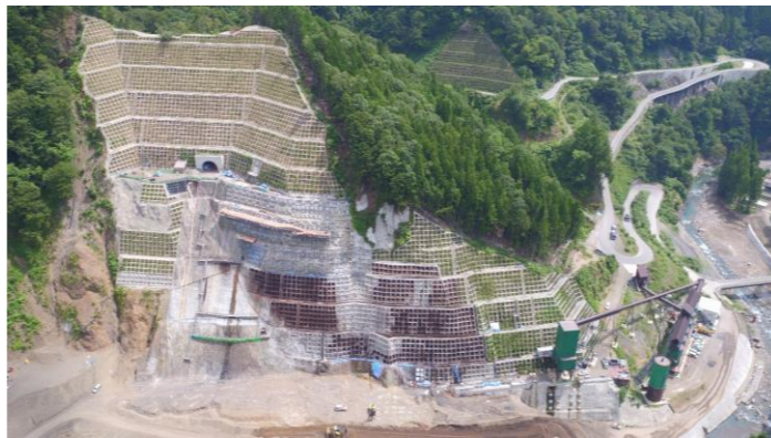
③ ダムサイト左岸状況(右岸上空より望む)