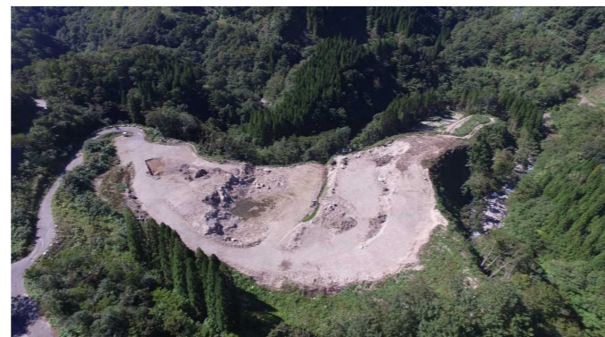
⑦ 原石山状況(上空より望む)