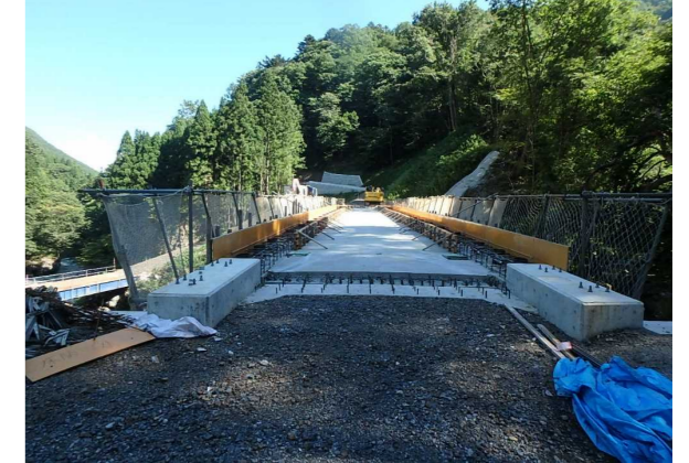
⑤ 下流工事用道路状況