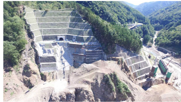
③ ダムサイト状況(右岸上空より望む)