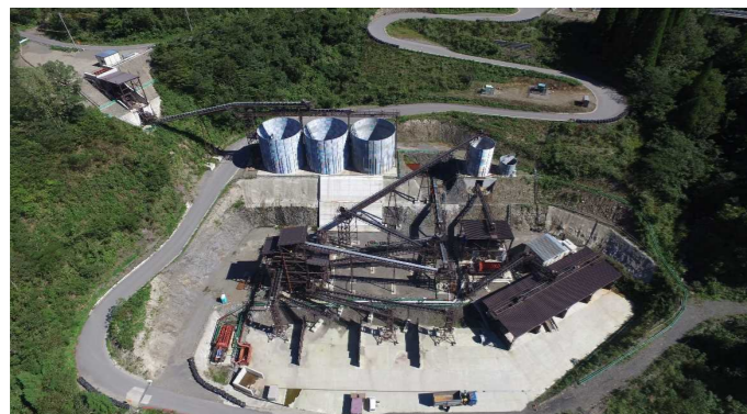
⑥ 骨材プラント状況(上空より望む)