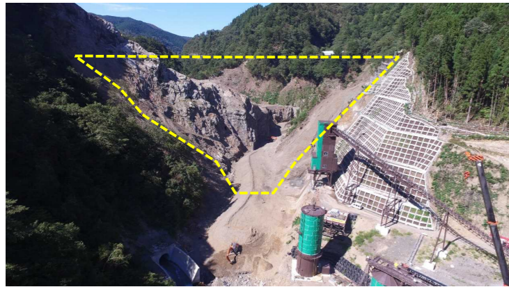
① ダムサイト状況(遠景:下流上空より望む)