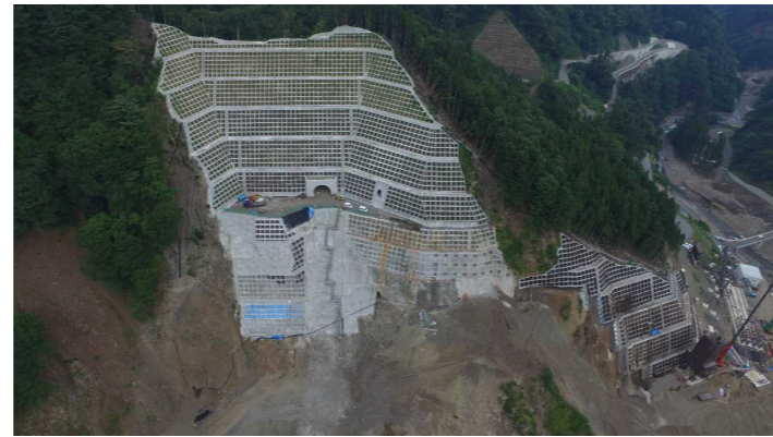
③ ダムサイト状況(右岸上空より望む)