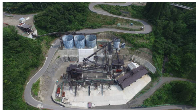
⑥ 骨材プラント状況(上空より望む)