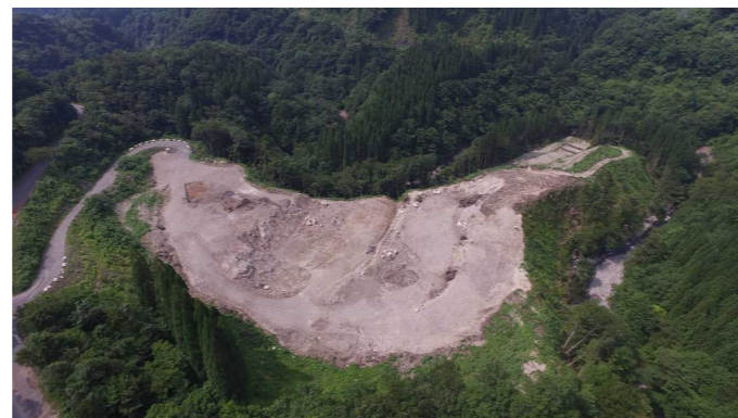
⑦ 原石山状況(上空より望む)