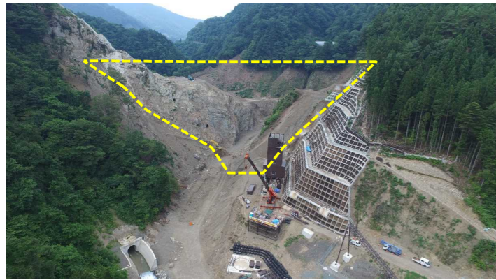
① ダムサイト状況(遠景:下流上空より望む)