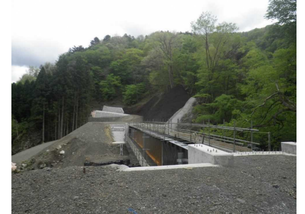
⑤ 下流工事用道路状況