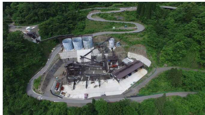
⑥ 骨材プラント状況(上空より望む)