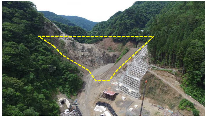
① ダムサイト状況(遠景:下流上空より望む)