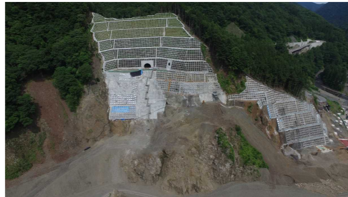
③ ダムサイト状況(右岸上空より望む)