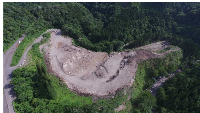
⑦ 原石山状況(上空より望む)