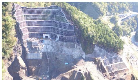
③ ダムサイト状況(右岸上空より望む)