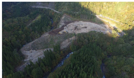
⑦ 原石山状況(上空より望む)