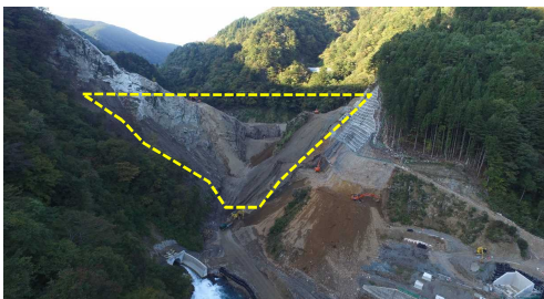
① ダムサイト状況(遠景:下流上空より望む)