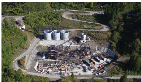
⑥ 骨材プラント状況(上空より望む)