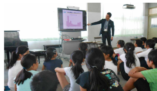
平成29年7月 岐阜市立加納西小学校6年生のみなさんと