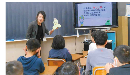
平成29年12月 山県市立梅原小学校4年生のみなさんと