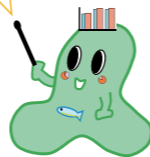
主な川の長さ（岐阜県内を流れる長さ）

飛騨地方には、標高3000m級の山々がそびえ、美濃地方には、海拔0mの水郷地帯があるね。