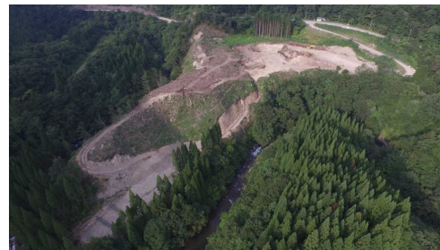
⑦ 原石山状況(上空より望む)