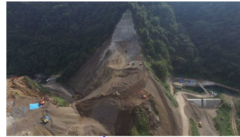
④ ダムサイト状況(左岸上空より望む)