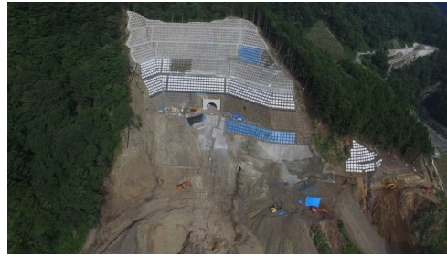
② ダムサイト状況(右岸上空より望む)