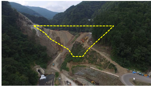
① ダムサイト状況(遠景:下流上空より望む)