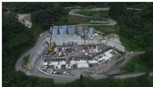
⑥ 骨材プラント状況(上空より望む)