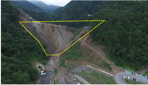
① ダムサイト状況(遠景:下流上空より望む)