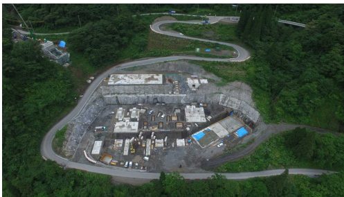
⑥ 骨材プラント状況(上空より望む)