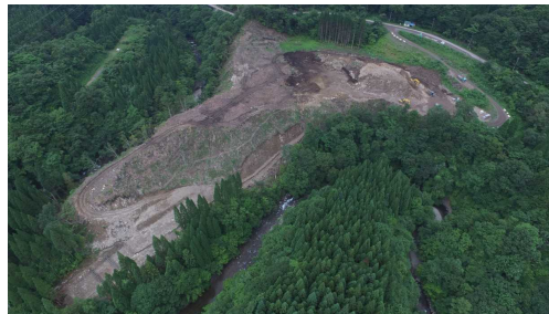
⑦ 原石山状況(上空より望む)