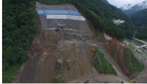
② ダムサイト状況(右岸上空より望む)