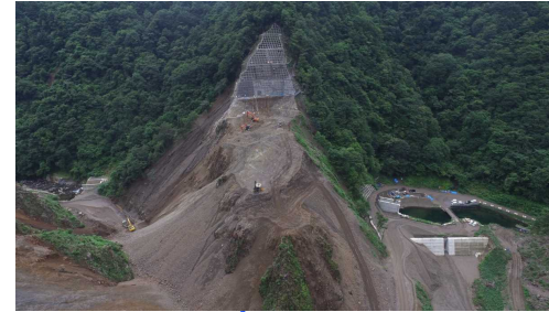
④ ダムサイト状況(左岸上空より望む)