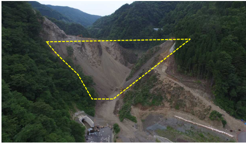
① ダムサイト状況(遠景:下流上空より望む)