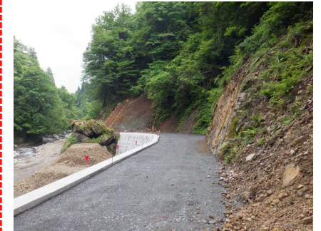
⑤ 下流工事用道路状況