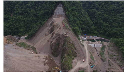
④ ダムサイト状況(左岸上空より望む)