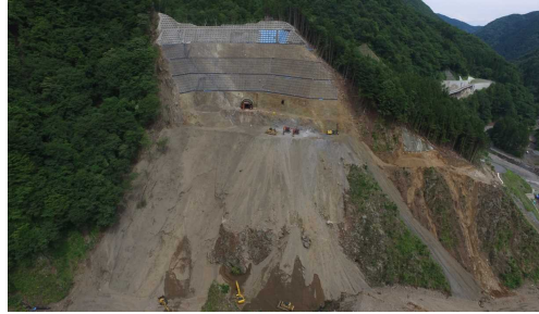
② ダムサイト状況(右岸上空より望む)