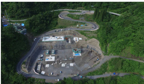
⑥ 骨材プラント状況(上空より望む)