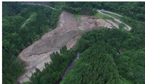
⑦ 原石山状況(上空より望む)