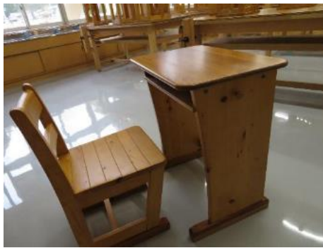
高山市内中学校(高山市)