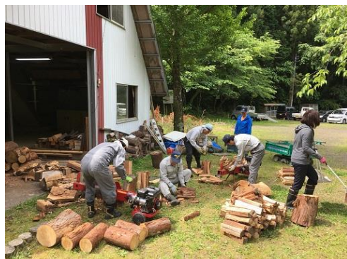
住民協働による里山整備活動 (三和まちづくり協議会)