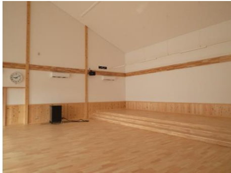
池田町立片山保育園(池田町)