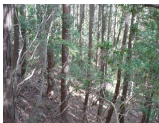
公有林化された森林 (八百津町)