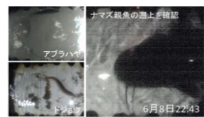
水田魚道遡上調査