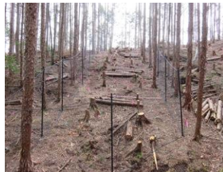
環境保全林効果検証事業 (中津川市高山日比渡瀬地内)