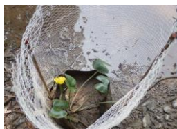
希少生物の生育調査 (ヒメコウホネ)