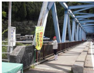
花火による追い払い (郡上漁業協同組合)