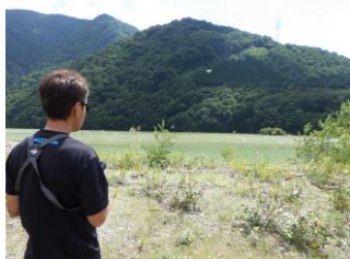
ドローンによる営巣状況の確認 (庄川漁業協同組合)