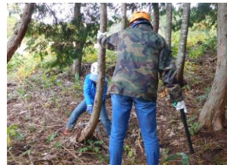
H30.10.20 里山保全活動 (郡上市・ひるがの高原)