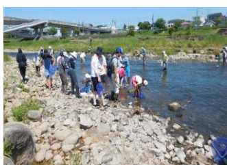
H30.7.22 水生生物調査 (可児市・可児川)