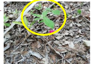
侵入した高木性種