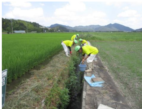
駆除状況(各務原市)