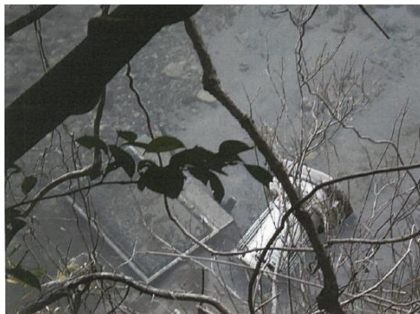
不法投棄物撤去前(板取川)