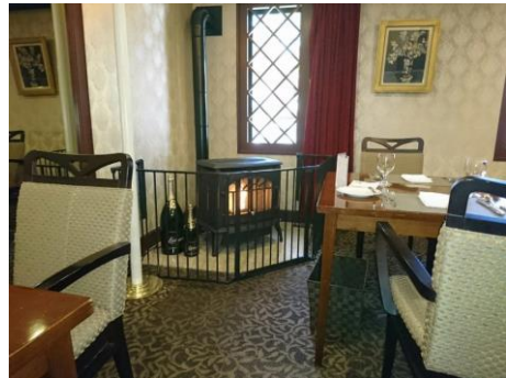
温泉旅館のロビー・レストランに導入されたペレットストーブ(下呂市)