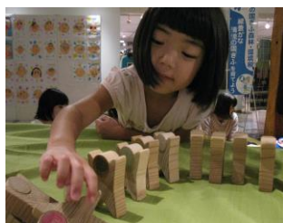
おもちゃで遊ぶ園児