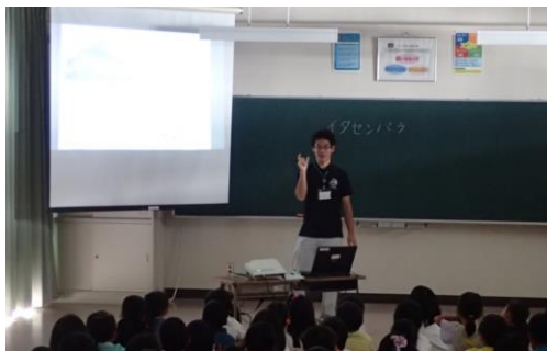
イタセンパラを活用した普及啓発