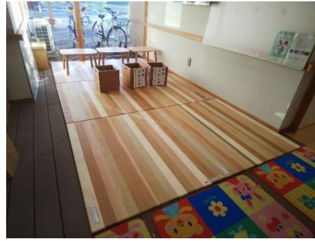
北方みなみ子ども館(北方町)