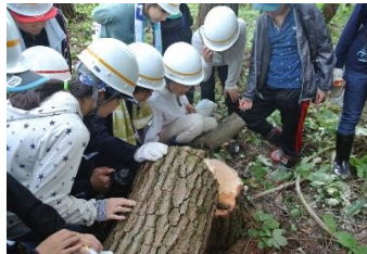
緑と水の子ども会議の実施