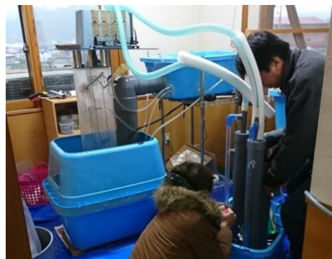
発電施設を利用した環境保全学習