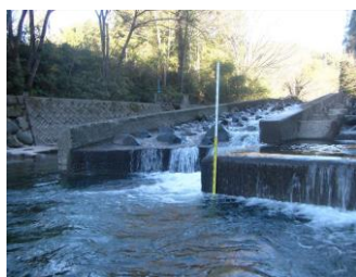
入り口に落差が生じてしまった魚道 【栗巣川(郡上市)】