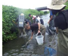
魚類群集調査状況