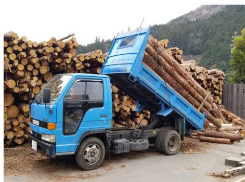
未利用材の搬出活動の様子(左:大垣市、右:白川町)