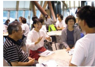
ぎふ木育交流会の開催