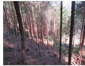
環境保全林効果検証事業 (高山市丹生川町町方コウノス地内)