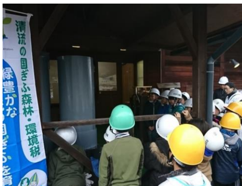
発電施設を利用した環境保全学習