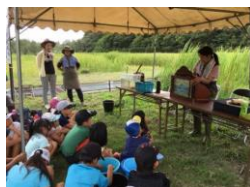
子ども達への環境教育 (生きもの紙芝居)