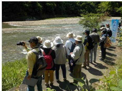
市民向け環境講座を実施 多治見市(たじみエコカレッジ運営事業)