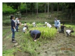
再生した水田での稲刈り体験