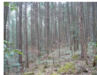
公有林化された森林 (白川町)