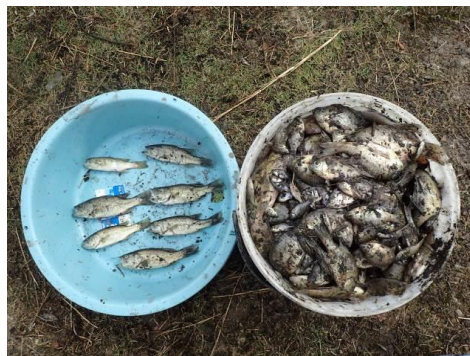
捕獲した外来種－郷戸池(各務原市)－