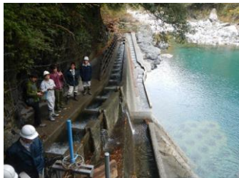
フィッシュウェイサポーターとの魚道点検