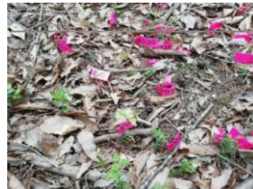
侵入個体の個別識別状況