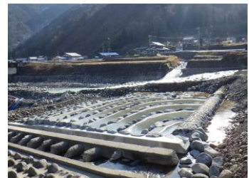
○魚道の修繕状況【長良川(郡上市) 左:修繕前 右:修繕後】