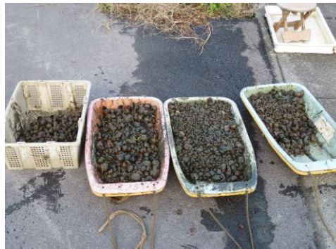
駆除した成貝(輪之内町)