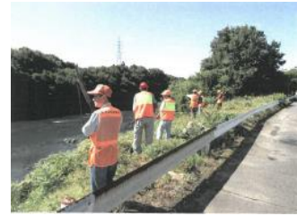
流域一斉対策 (可茂管内3漁業協同組合)