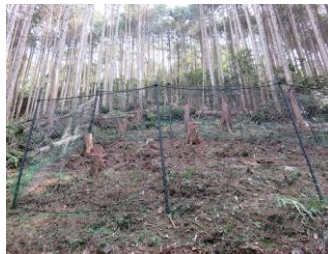
環境保全林効果検証事業 (八百津町八百津隠玄田地内)