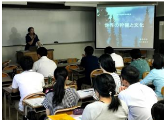
H30.8.23 教員免許状更新講習