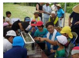
排水路での生き物調査