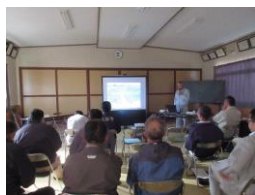
水田魚道設置研修(座学)