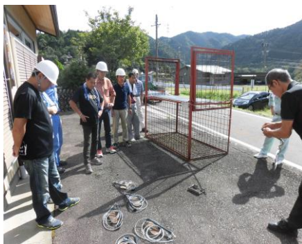
捕獲体制整備事業(集落での研修の様子)