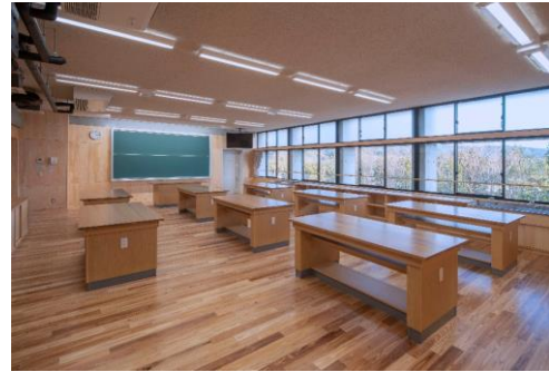
瑞浪市立瑞浪北中学校校舎(瑞浪市)