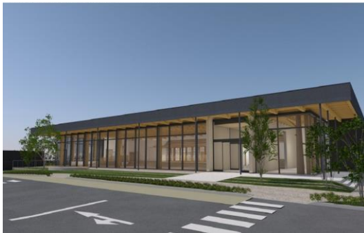
ぎふ木遊館 正面 イメージ