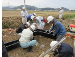
水田魚道設置研修(実習)