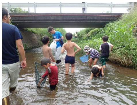
長良川での川遊び、自然体験 ( (特非)長良川自然学校)