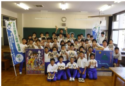
市内小中学校において、おどり下駄等を製作 郡上市(平成30年度郡上木育推進モデル事業)