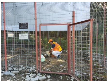
活動の様子(サル捕獲オリを管理する様子)