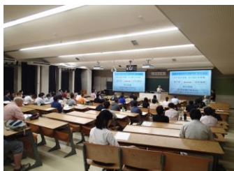
H30.6.16 連続講座「野生動物を知る」第1回 鳥獣行政と「専門家・研究機関」のあゆみ