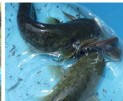
落差解消を実施した関市千足地区での効果検証(事前調査)の様子