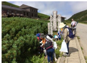
H30.8.18 外来植物駆除 (高山市・乗鞍岳)