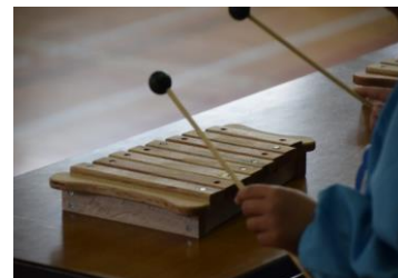
学習用教材として活用