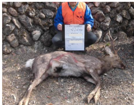
個体数調整事業取組状況(捕獲されたニホンジカ)