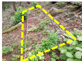
高木性樹種の侵入調査プロット