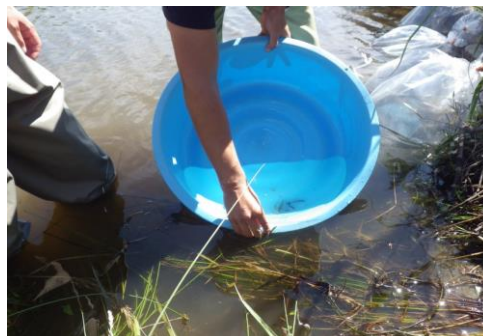
イタセンパラの試験放流