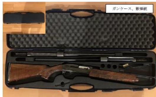
平成30年度事業で購入された銃