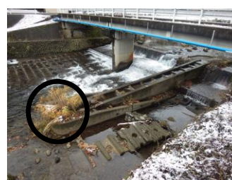
土砂が堆積してしまった魚道 【前川(郡上市)】