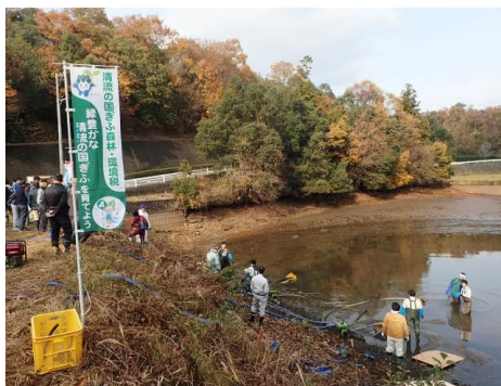
捕獲状況－大洞池(富加町)－