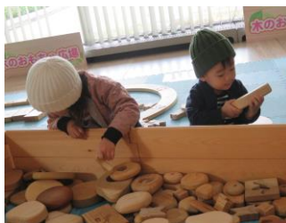
おもちゃで遊ぶ園児