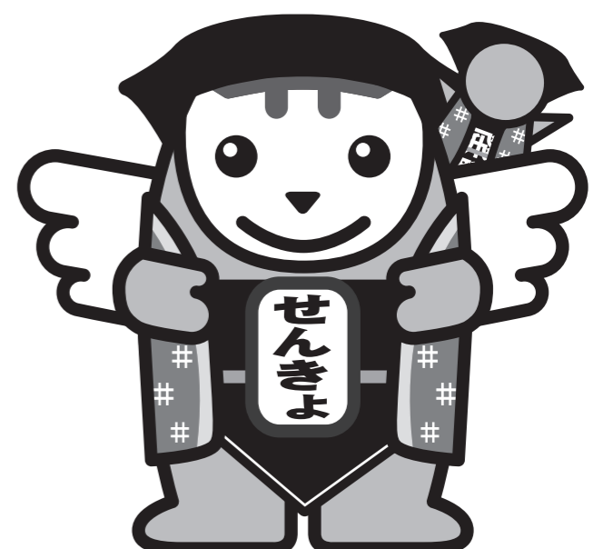
岐阜県の明るい選挙推進イメージキャラクター さるぼぼめいすいくん