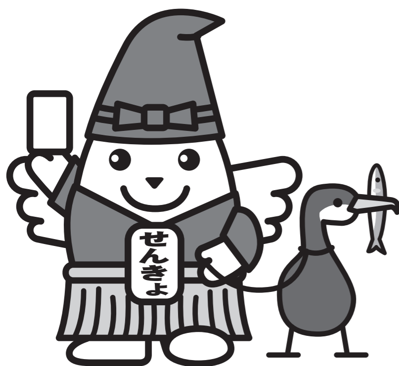
岐阜県の明るい選挙推進イメージキャラクター 鶺鴒めいすいくん

仕事や旅行などの理由で、投票日に投票所へ行けない見込みの方は、期日前投票ができます。 場所や時間など、詳しくは、お住まいの市町村の選挙管理委員会へおたずねください。