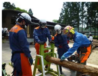
風倒木伐採訓練装置