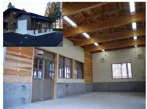
センター外観と内装

そこで、鳥取県では、効率的で安全な林業を実践しているオーストリアをモデルとし、平成26年度から調査団の派遣や技術導入に向けた取組を実施してきました。その技術導入の一環として、オーストリアの森林研修所を参考とした、伐倒等を徹底して反復訓練・教育できる「とっとり林業技術訓練センター（愛称：Gut Holz）」を全国に先駆けて平成29年3月に開設しました。