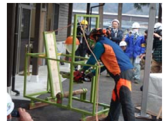
キックバック装置

本センターは、県の実施する研修や国の「緑の雇用」事業のほか、地元の農林高校の研修や消防の訓練にも活用されています。研修生からは「いきなり山で伐採するより、安全な練習環境で基礎を反復訓練できてよい」、「周囲で見られながら、すぐ指摘を受けられるので上達が早い」といった声が聞かれるなどとても好評のことです。