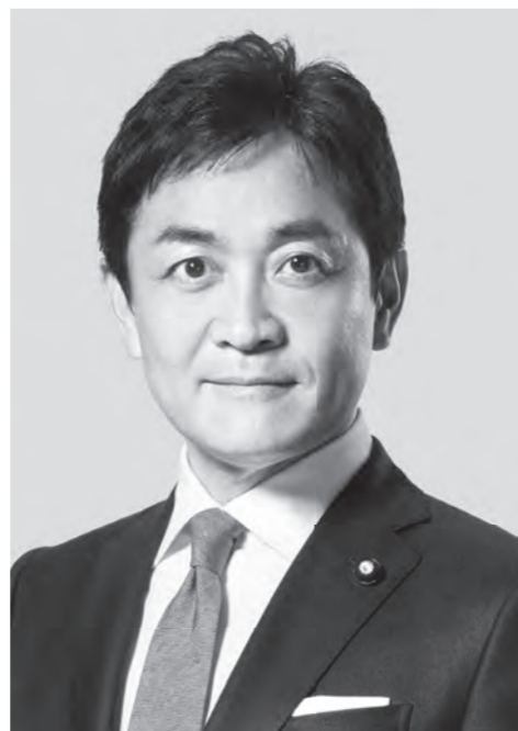
国民民主党 代表 玉木 雄一郎