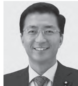
党副委員長 山下 よしき 現 59歳。参院議員3期。