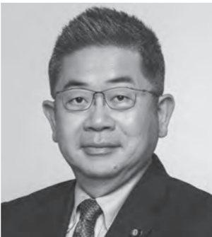
党書記局長 小池 晃 現 59歳。参院議員3期。全国革新懇代表世話人。医師。