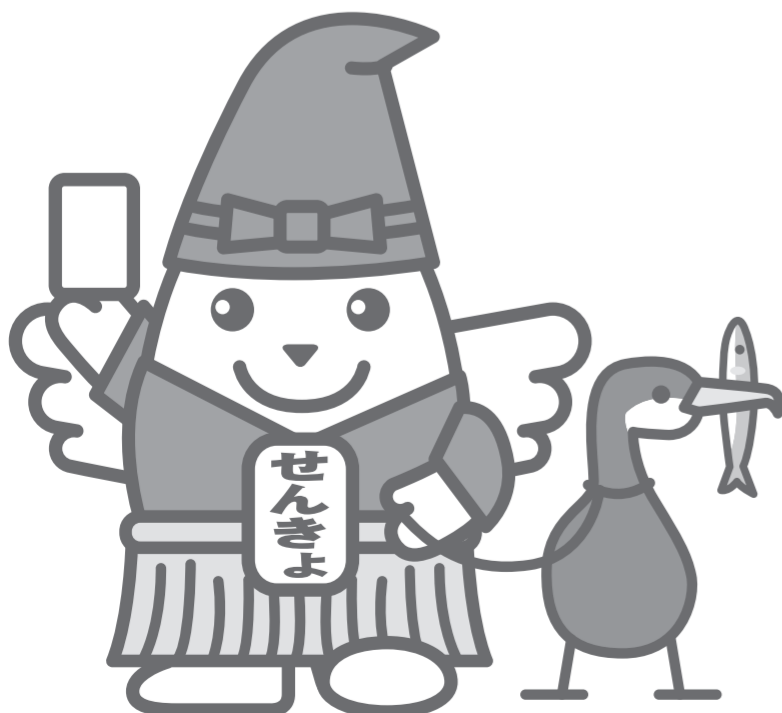
岐阜県の明るい選挙推進イメージキャラクター 鵜飼めいすいくん