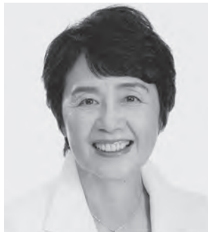
党農林・漁民局長 紙 智子 現 64歳。参院議員3期。