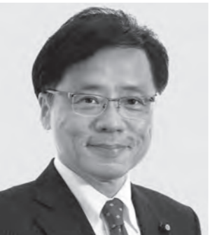
党参院幹事長・国対委員長 井上 さとし 現 61歳。参院議員3期。