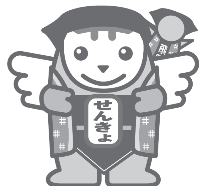
岐阜県の明るい選挙推進イメージキャラクター さるぼぼめいすいくん