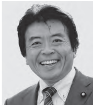
弁護士 仁比 そうへい 現 55歳。参院議員2期。党参院国対副委員長。