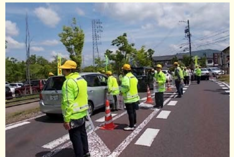
春の交通安全運動期間中に「ニセ電話詐欺にも気をつけて」とチラシやグッズを配布しました。

4月に市内の男性が、架空請求詐欺被害に遭い、15万円騙し盗られるという被害が発生しました。携帯電話に有料動画サイトの利用料金に関するメールが届き、表示の連絡先に架電すると、電子マネーで支払うよう要求され、コンビニで電子マネーを購入してID番号を教えました。