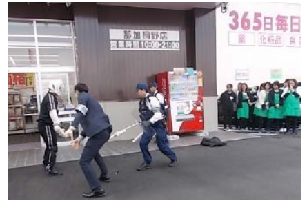
コスモス那加桐野店

市内で、万引き被害が多発（4月末45件発生）しているため、各務原警察署は、イオン各務原店で店長対象の防犯講話、ドラッグストアコス