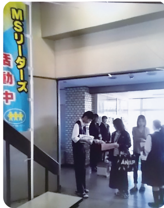
岐阜各務野高校MS活動