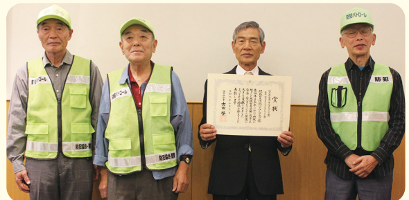
○緑苑自主防犯パトロール・グループ