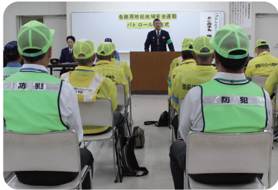
パトロール隊出発式