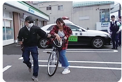
外国人実習生に対する防犯指導