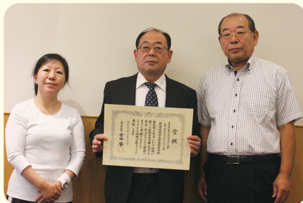
○尾崎地域安全推進協議会