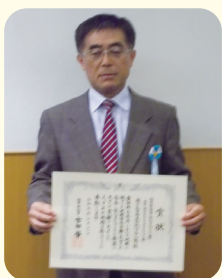
○琴ヶ丘自治体 パトロール隊