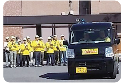
パトロール隊出発式