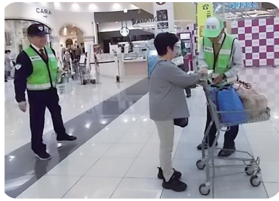
イオン各務原店啓発活動

10月11日から20日に行われた全国地域安全運動の期間中、各務原警察署では各団体と協力してパトロール活動の強化、街頭犯罪被害防止などの啓発活動を行いました。