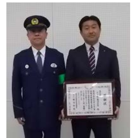
十六銀行鷺沼支店