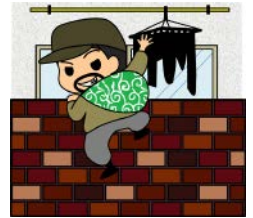
昨年1～12月の各務原市内の主な街頭犯罪・侵入犯罪の発生状況(暫定値)

昨年1～12月の県内の刑法犯認知件数は12,858件、前年に比べると374件の減少でしたが、各務原市内においては、1,140件の発生で、前年より19件の増加となりました。中でも物干し場や庭先、ベランダ、コインランドリー等から女性の衣類・下着を盗む色情ねらいが78件発生、昨年より60件大幅に増加しました。被害に遭わないためには、下着類は外から見えない屋内に干す、コインランドリーでは目を離さないなど対策を取ってください。