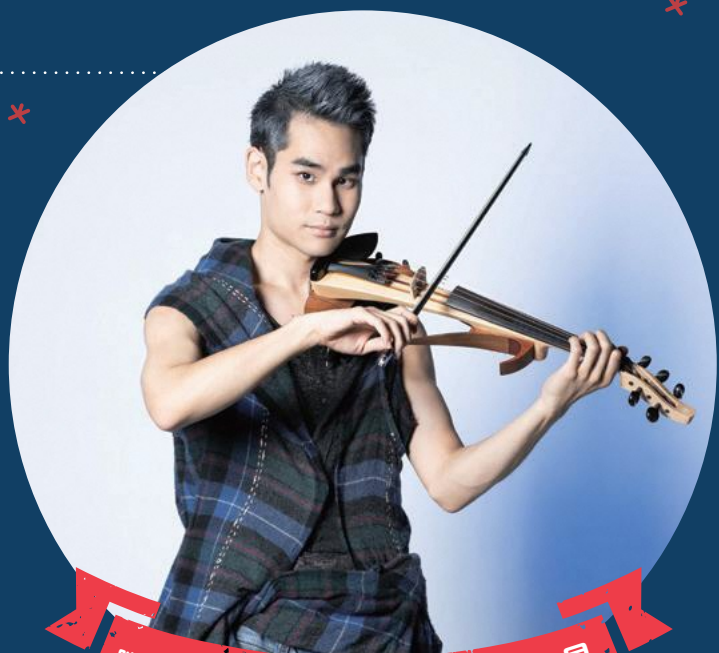
脳性まひのポップバイオリニスト 式町水晶