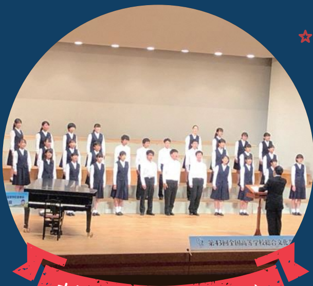
大垣北高等学校音楽部(合唱)