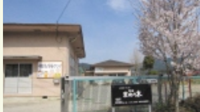
活動拠点「ふれあいセンターまめの木」