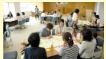
神戸町「神女会議」のグループワーク