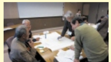
美濃加茂市のグループワーク