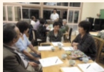
見守り事業情報交換会