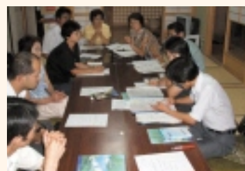
平成17年 支え合いマップづくり会議