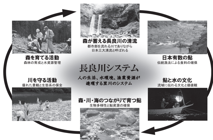
図2-4-3 長良川システム

今後、「清流長良川の鮎」を進化させながら、将来にわたり守り伝えるため、世界農業遺産「清流長良川の鮎」アクションプランに基づく取組みを着実に進める。