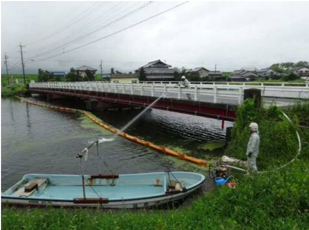
写真 4.1 高圧水放水による攪拌作業状況 (H29)