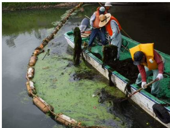
写真 4.6 ウキクサ回収状況 (H29 実施)