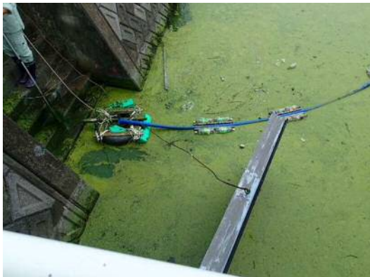
写真 4.4 水中ポンプによる水の汲み上げ(H28 実施)