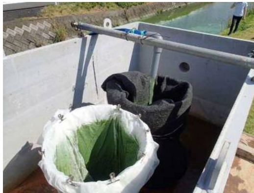
写真 4.5 フィルター材によるアオコの回収(H28 実施)