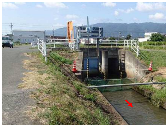
写真 4.7 水門の開放状況 (H28 実施)