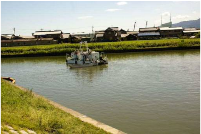
写真 4.3 水質対策船による攪拌 (H24 実施)