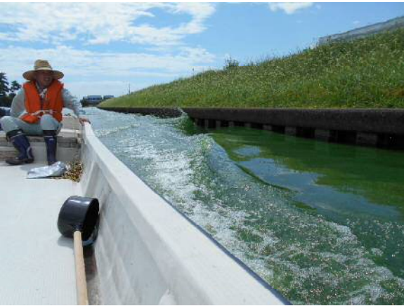
写真 4.2 モーターボートによる攪拌 (H28 実施)