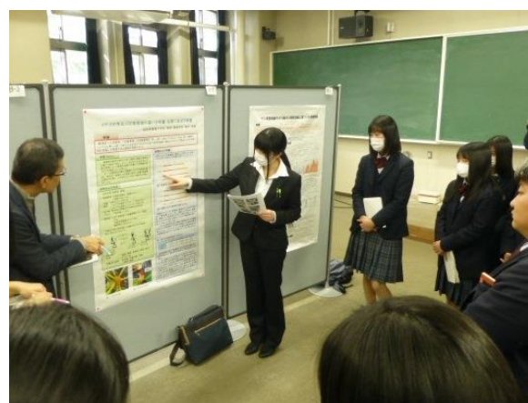
(写真)ポスター発表を行う本校学生たち