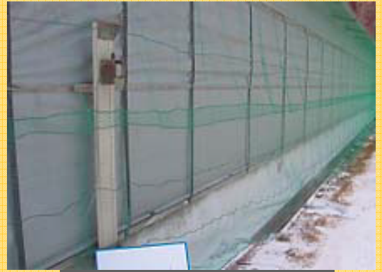
防鳥ネット(設置例) (網目2cm以下が目安)