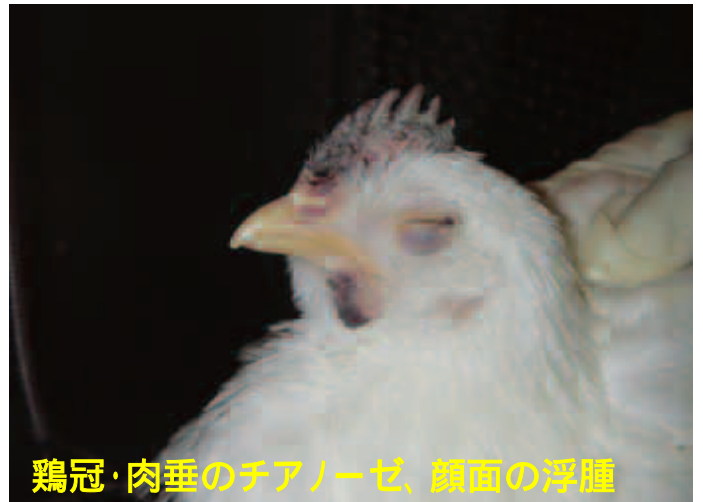
鶏冠・肉垂のチアノーゼ、顔面の浮腫