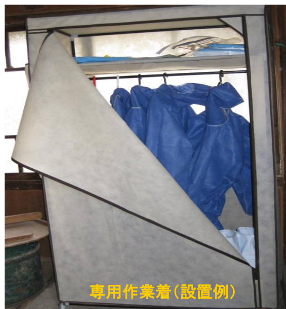
専用作業着(設置例)