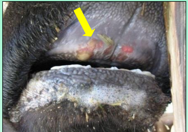
口内のびらん(ただれ)