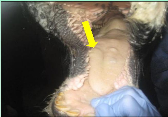
舌の水ぶくれ(初期の症状)