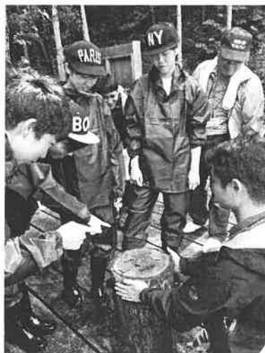
▲昨年度の体験の様子 （下川町にて）