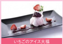
いちごのアイス大福