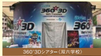
360°3Dシアター(双六学校)