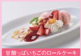
甘酸っぱいちごのロールケーキ