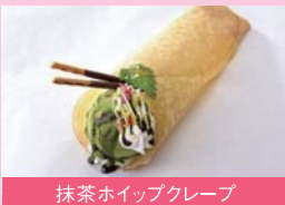
抹茶ホイップクレープ