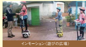
インモーション(遊びの広場)