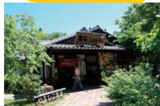
22 農家レストラン「やまびこ」