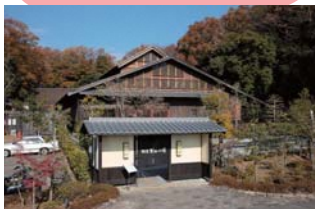
1 里山の湯 / 里山食堂

土日祝日は、古い民家で自家製どぶろく、うどんが食べられます。 オルゴール作りや籐のクラフト体験も開催しています。