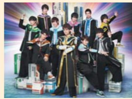
BOYS AND MEN