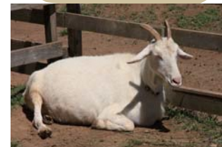
33 里山ふれあい牧場