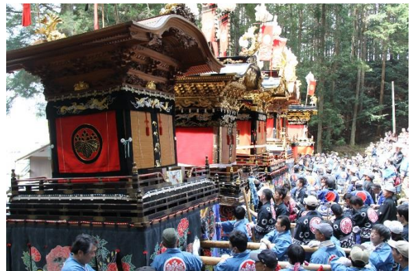
久田見祭りの様子