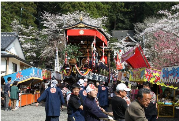
八百津祭りの様子