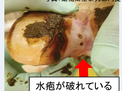
水疱が破れている