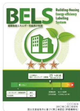
〔図1〕 ガイドラインに基づく第三者認証の例

また、デマンドリスポンスに対応した時間帯別・季節別の電気料金メニューが選択できる場合はその活用に努めるとともに、エネルギー管理システム（BEMS・HEMS等）の導入により、ビルの運用方法、住宅の住まい方の改善によるピーク対策及び省エネルギーに努めること。