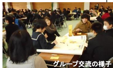
グループ交流の様子