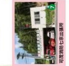
7 可成消防七宗出張所