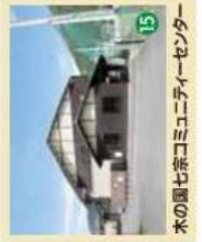
15 木の園七宗コミュニティセンター