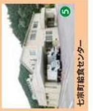
5 七宗町給食センター