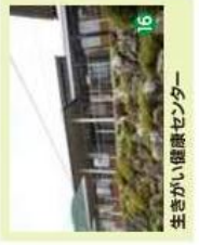
16 七宗町水管理センター