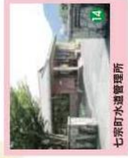
14 七宗町水道管理所