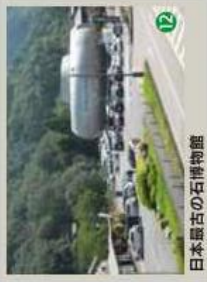
12 日本最古の石博物館