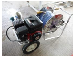
消毒用動力噴霧器