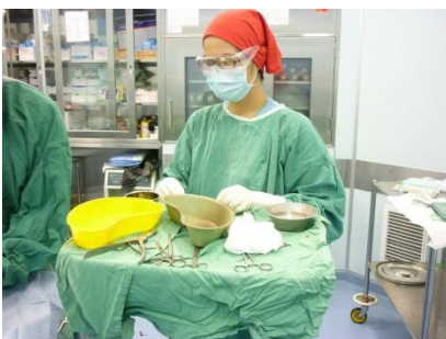
←右 手術介助中の写真

配属先の外来/手術室棟は JICA の無償資金協力によって 2014 年建てられたものです。