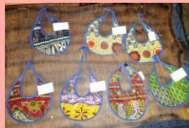
足踏みミシンを使用し、商品を作成中。 商品の一例。赤ちゃん用スタイ。