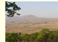
保存状態の良い壁画は山を登ったところにあり、景色も良い

先月、私の両親がマラウイに来てくれました! 周辺国と比べマラウイには魅力的な観光地が少ないので満足してもらえたか心配だったのですが、上記の観光地の2カ所を訪れ、また村人達との交流を通して、マラウイとマラウイ人の人柄の良さを感じてもらうことができました。皆さんも機会があればぜひマラウイに遊びに来てください!! Zikomo!! Yewo!! Tionanenge!