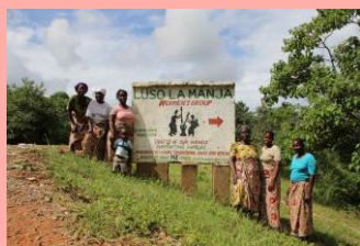
女性グループ Luso la manja

2003年現リーダーの女性が失職したことをきっかけに、商品作りを始める。始めは全て手縫いで行っていたが、当時他国ボランティアの支援もあり、ようやく1台のミシンを購入。裁縫やミシンは初心者であったが、夫から教わりながら技術を習得。現在ではメンバーも8人となり、各々がミシンを持てるまでになった。現在彼女たちは、援助に頼らず売り上げだけで自分たちのお店をオープンしようと奮闘中。自給自足の生活で現金収入を得るのが難しい中、彼女たちの売り上げが家計を支えている。