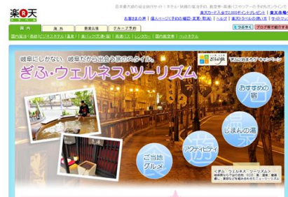
※今夏に実施したタイアップ企画ページ

楽天トラベル( http://travel.rakuten.co.jp/ )で発売。 併せて、12月から2月にかけて楽天トラベルで展開する、岐阜県観光連盟と楽天トラベルのタイアップ企画で、同プランのPR特集ページを開設する予定。