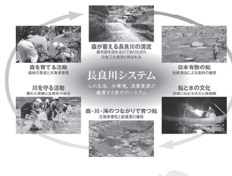
図2-1-2 長良川システム

この「清流長良川の鮎」を進化させながら、将来にわたって守り伝えていくため、世界農業遺産「清流長良川の鮎」アクションプランに基づく取組みを着実に進めていく。