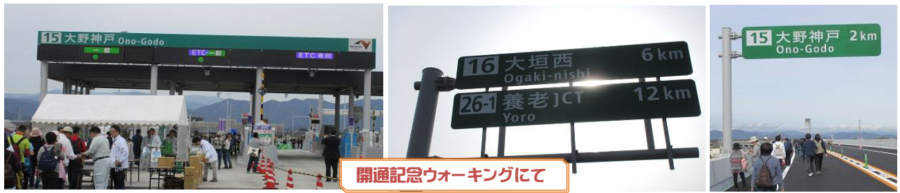
開通記念ウォーキングにて

※ 普通車通行料金：大垣（17km 770円）、関ヶ原（25km 970円）、一宮（37km 1310円）など