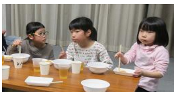
おいしいです おいしょ！ 夜警出発