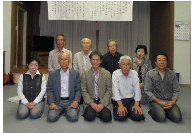
白鳥の代表(3名)と横井狂俳保存会の皆さん

七月の地蔵堂例祭には、入選62句が行灯となって奉燈されます。おもしろ文芸は、開巻と同時に 28 句が奉燈され、短冊と記念品が贈呈されます。