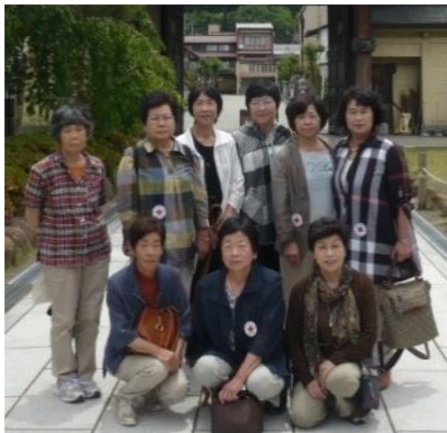
横井支部の皆さん