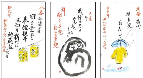
第10回(H10) 第11回(H11) 第12回(H12)