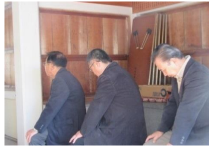
氏子総代の皆さん