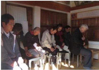
各組織の代表者の皆さん