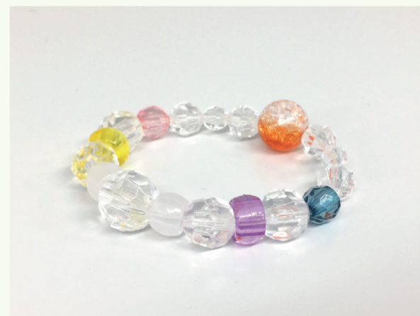
▲ソーラービーズブレスレット