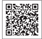
うちエコ診断ページ

トップページ > くらし・防災・環境 > 環境 > 地球温暖化防止 > うちエコ診断